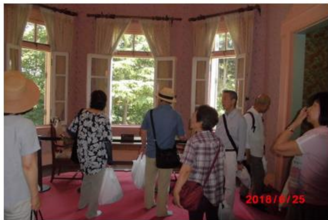
6/25 ハイキングⅫ6月例会 アメ横→岩崎庭園→根津神社→回子坂→谷中銀座散策

梅雨明けを思わせる様な、カンカン照りになりましたが、男性5人女性5人合計10人参加。急ぐ旅でもないので京浜東北線で上野駅からアメ横を歩く。まだ午前中だからか？普段より人通りが少なく感じられる。昔ながらの時計やライター、サクランボなどの季節の果物や、外人向けの派手な洋服などの販売されている。早く着き過ぎたが昼食は焼肉です。夜は居酒屋の北海道「マルハ酒場」で食事。目の前で焼くのではなく丼ものを注文するようになっている。牛カルピ井等で美味しく頂く。