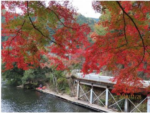
11/26 紅葉の鎌北湖から宿谷の滝へ

快晴に恵まれた大宮駅に集合したのは9人、途中乗車予定の2人を含めて今回は11名の参加です。川越から東上線で坂戸、乗り換えて東毛呂駅で下車、以前ゆずの里ハイキングで下車した駅です。本来ならここから歩くのですが1.3 km以上になるので僅かでもバスを利用することに。